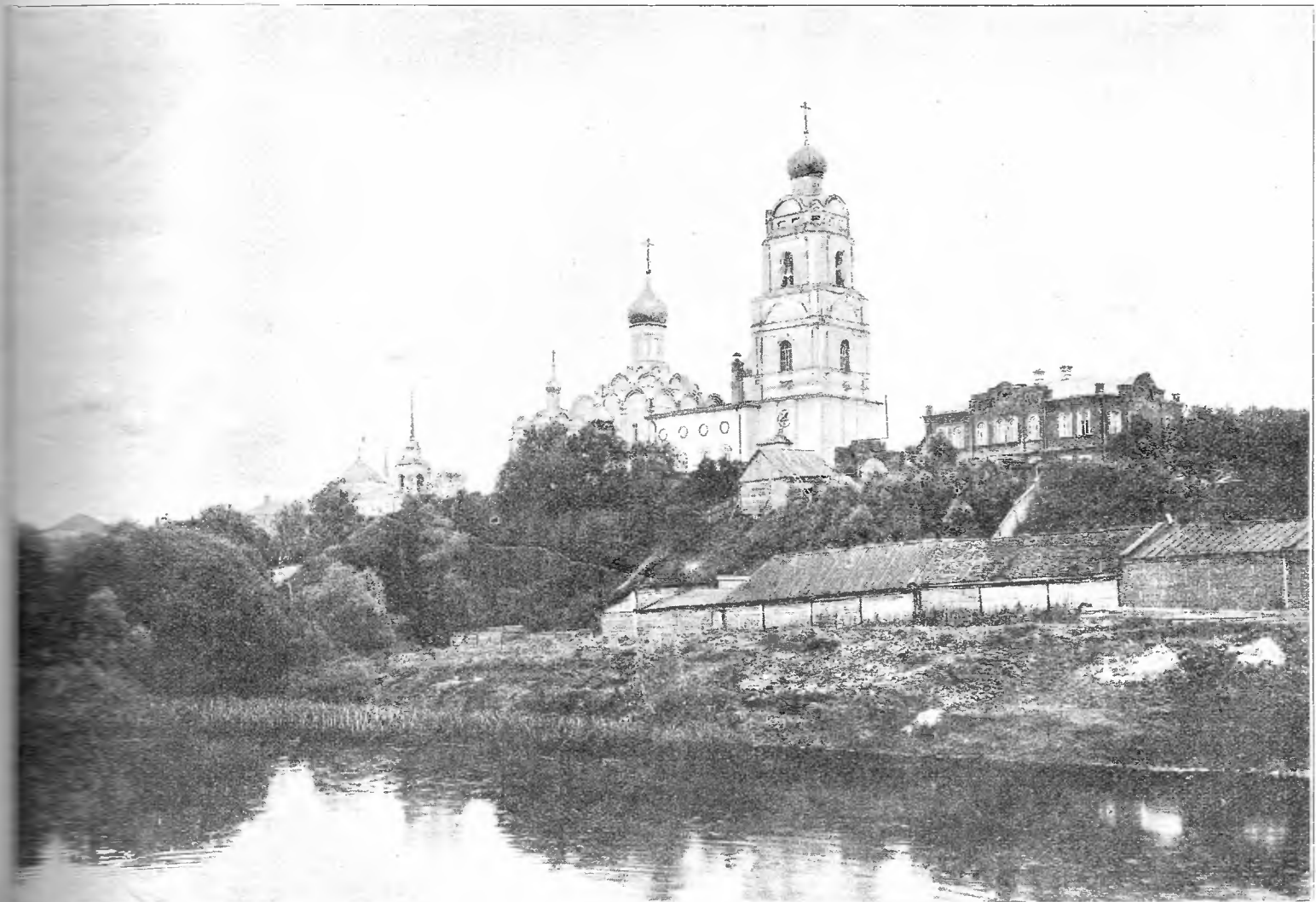
По святымъ мѣстамъ. — Аркадѣевскій монастырь въ Вязьмѣ.

„Русскій Паломникъ“ одобренъ всеми вѣдо-ствами.