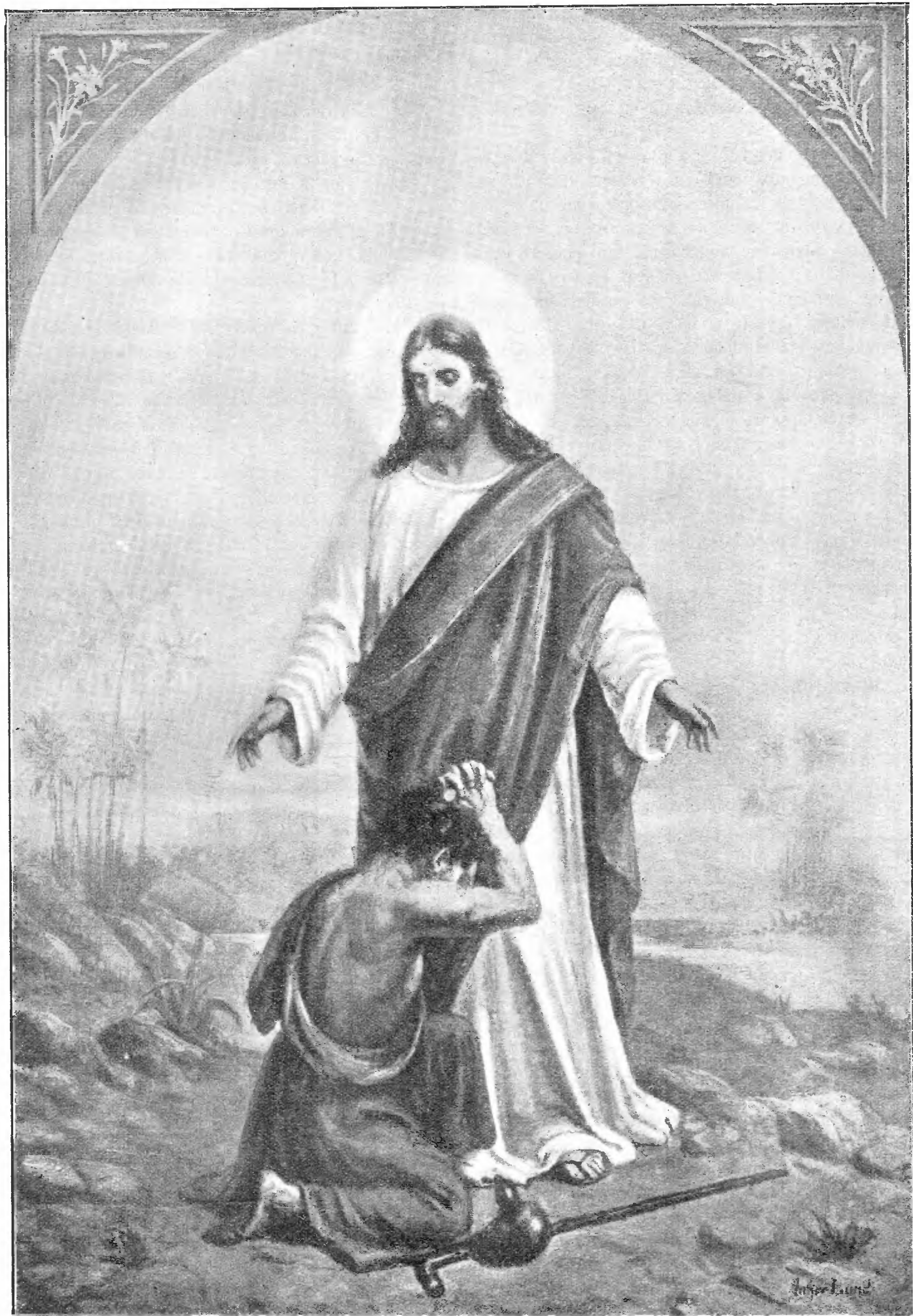
«ПРИДИТЕ КО МНѢ ВСѢ ТРУЖДАЮЩЕСЯ И ОБРЕМЕНЕННЫЕ, И Я УСПОКОЮ ВАСЬ». (Съ картины худ. Лунда.—Мѣ. XI. 28).