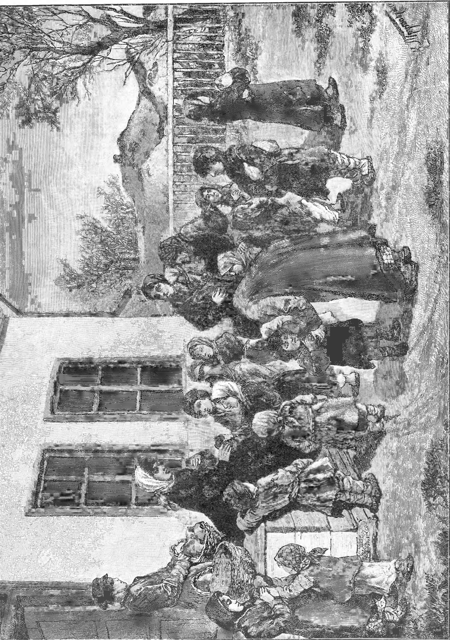
БЛАГОТВОРИТЕЛНИЦА. (Съ картинъ худ. Трутовскаго).