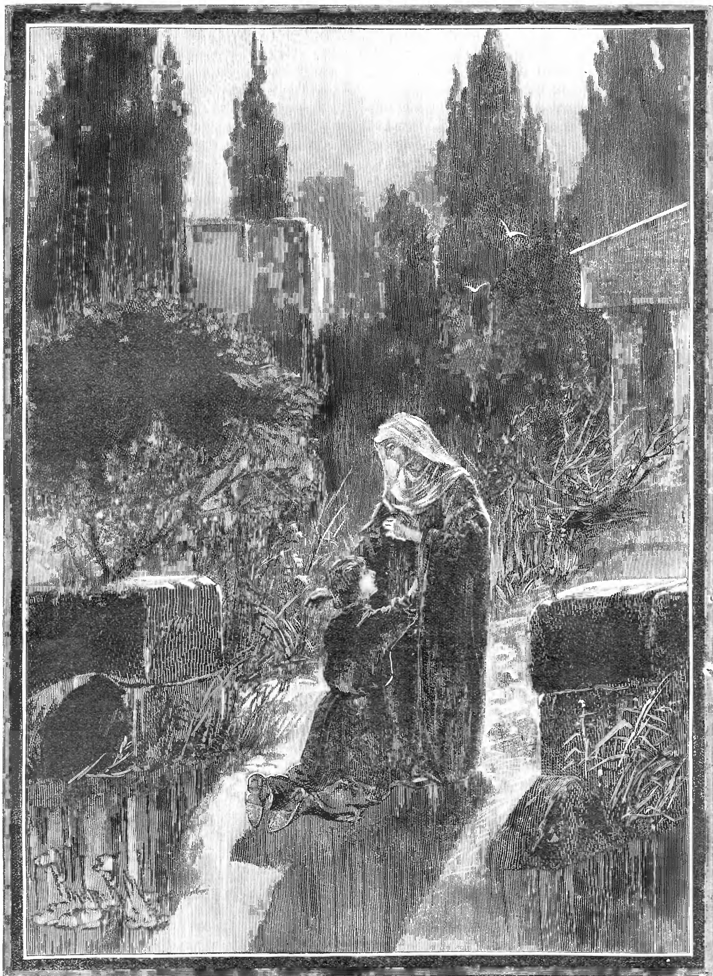
ВОЗВРАЩЕНИЕ СВ. ЛУКИ ЭВАНГЕЛИСТА КЪ СВОЕЙ МАТЕРИ. (Рисунокъ Викторова.—Къ стр 82).